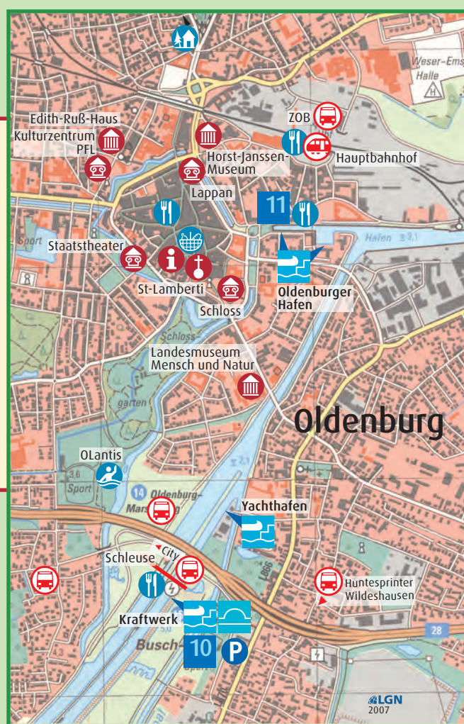
Vervielfältigungserlaubnis für die TK 25 erteilt durch die GL Oldenburg vom 16.1.2007 (D2 23371 N)

Kleine Kirchenstraße 10 | 26122 Oldenburg Tel. 01805-93 83 33 (14 Cent/Min.) | Fax 0441-361 61 35 0 info@oldenburg-tourist.de | www.oldenburg-tourist.de